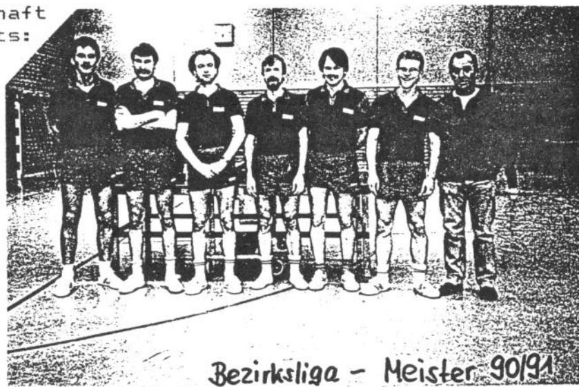
Bezirksliga - Meister 90/91