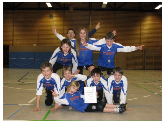
D-Jugend: Bronze beim WM

Zu einem Problem im Trainingsbetrieb kam es durch die Sperrung der Schwarzwaldhalle, dadurch fiel das Herrentraining am Dienstag aus und man musste in der THH wieder zusammenrücken.