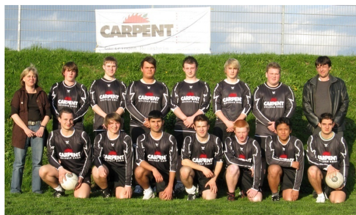
Männliche A-Jugend mit ihren neuen Trikots

Bei den Jugendteams fehlte in diesem Jahr die ganz große Überraschung, für die allerdings fast die erste E-Jugendmannschaft gesorgt hätte, die im Halbfinale der WM nur ganz knapp am TSV Calw gescheitert ist. Am Ende stand trotzdem ein hervorragender vierter Platz zu Buche. Und auch die männliche A-Jugend schaffte es bis zur WM, agierte dort aber etwas unglücklich und qualifizierte sich nicht fürs Halbfinale und wurde am Ende Fünfter. Titel gab es für die Teams der weiblichen C-Jugend und der D-Jugend die jeweils Landesligameister wurden.