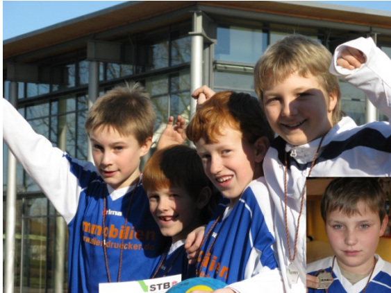
E-Jugend: Silber bei WM