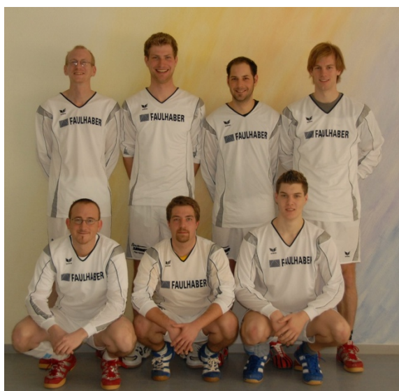
Herren 1: Aufsteiger in Schwabenliga